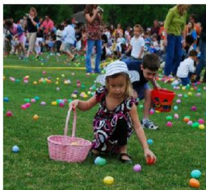
EGG HUNT /EG HANT/