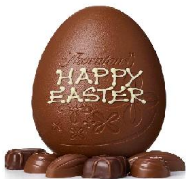
CHOCOLATE EGG /ČOKLIT EG/