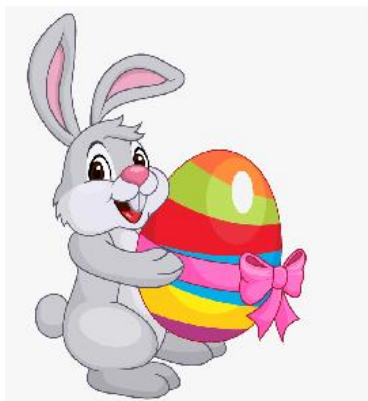
EASTER BUNNY /ISTR BANI/