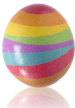
EASTER EGG /ISTR EG/